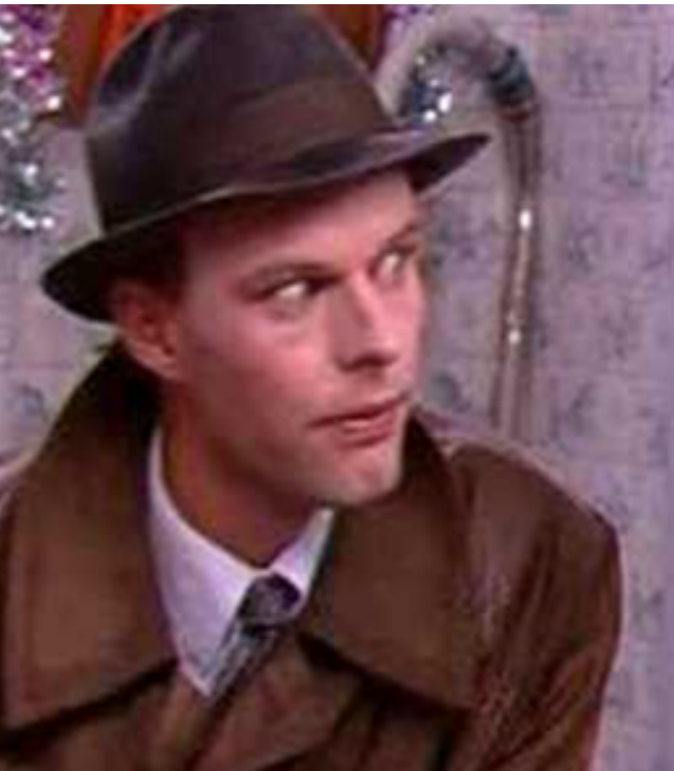
Her er mannen på hytta og bilen hans.

På andre siden av veien ligger det en stor, fin hytte. Utenfor står det en svart bil. Den ser skummel ut og Stian skriver mistenkt nr. 2, Mann med hatt.